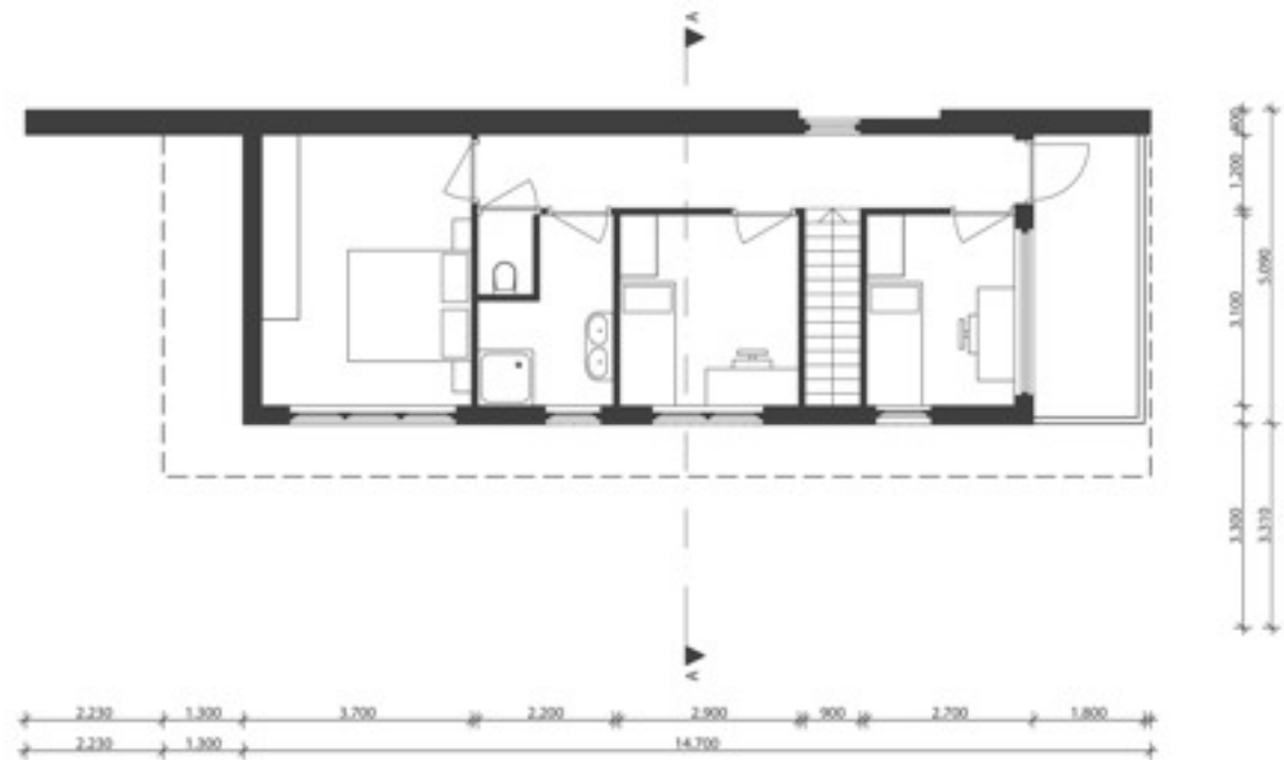
plattegrond eerste verdieping

De verdieping is opgebouwd langs een derde as. Deze as loopt langs de noordelijke gevel en ontsluit een ouderslaapkamer, twee kinderkamers en een balkon. Ook de badkamer en een apart toilet liggen aan deze as.