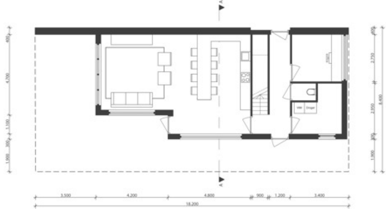
plattegrond begane grond

De zithoek is geplaatst aan het grote overdekte terras. Grote openslaande deuren zorgen hier voor veel licht en het gevoel dat de ruimte doorloopt naar buiten toe. De ramen worden voorzien van kunststof kozijnen met 3-dubbel HR++ glas. Deze zijn naar onderhoud toe het type kozijn met de kleinste voetafdruk.